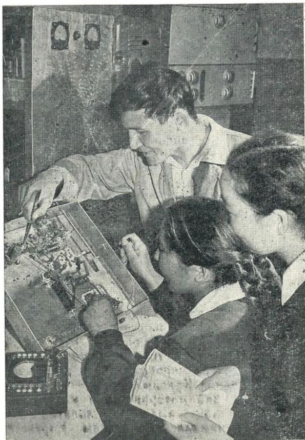
Кружок радио в школе-интернате