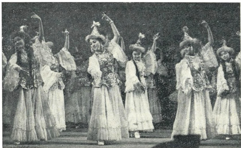
Танец девушек в исполнении хореографического женского ансамбля. Казахская ССР

В Таджикской ССР в 1938 г. было свыше 20 тыс. рабочих, из них 3,7 тыс. работниц-таджичек, тогда как в 1913 г. в кустарных предприятиях здесь насчитывалось немногим более 200 рабочих [640, 9.X.1952].