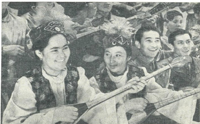
Самодельный оркестр народных инструментов

В порядке подготовки к совещанию была организована проверка состояния работы с выдвиженками. Во все центральные учреждения были направлены активистки, которые затем и выступили на совещании. Такой метод работы оправдал себя. Он способствовал преодолению консерватизма руководителей некоторых отраслей народного хозяйства, а также повышению общественно-политической активности самих узбечек [303, ф. 3316, оп. 21, д. 688, л. 23, 24].