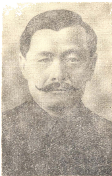
Табылды Жукеев — Александр Александрович Пудовкин.