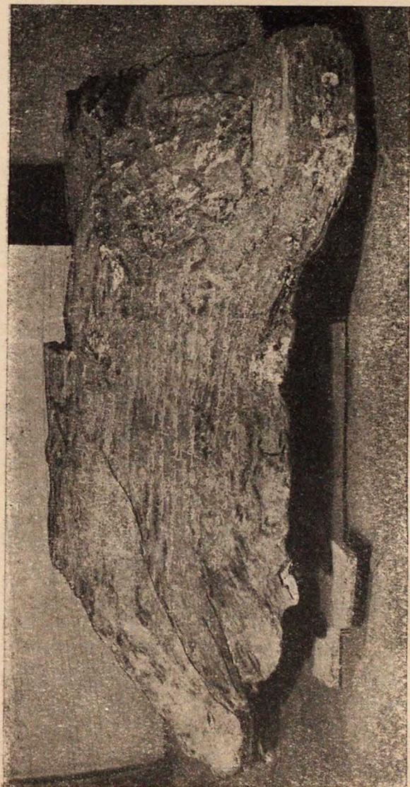
Вид камня с надписью.