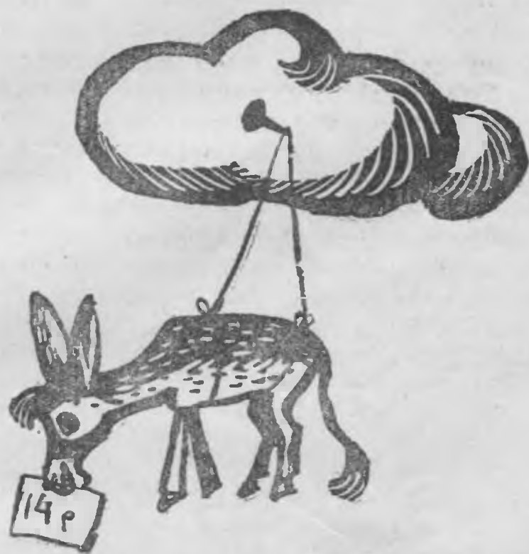
Рис. Е. Асманова

— Эх, брат, брат... Своего аллаха я знаю лучше тебя. Осел стоит 14 рублей, а у меня денег всего 10 рублей. Мой аллах ни на грош не снизит цену на осла.