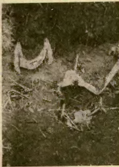
Возле мазара Кара-Кылы. Туркмения, 1955 г.

Причин здесь много, корни их уходят в далекое прошлое. Традиционно имели немалое значение религиозные воззрения, укоренившиеся веками. Общение живых с духами предков у среднеазиатских народов считалось не только возможным, но и обязательным: предки приносили удачу и благополучие в дом; в свою очередь они требовали повседневного почтения и вполне реальных забот о себе. До наших дней дожил связанный с этим обряд «джума акшом» (канун пятницы), когда духи предков якобы навещают своих близких и их полагается кормить, дабы не навлечь на себя